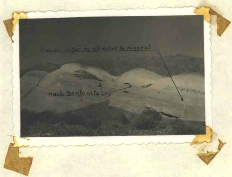
Vista parcial del yacimiento y lugar donde probablemente se extra- je mineral.-