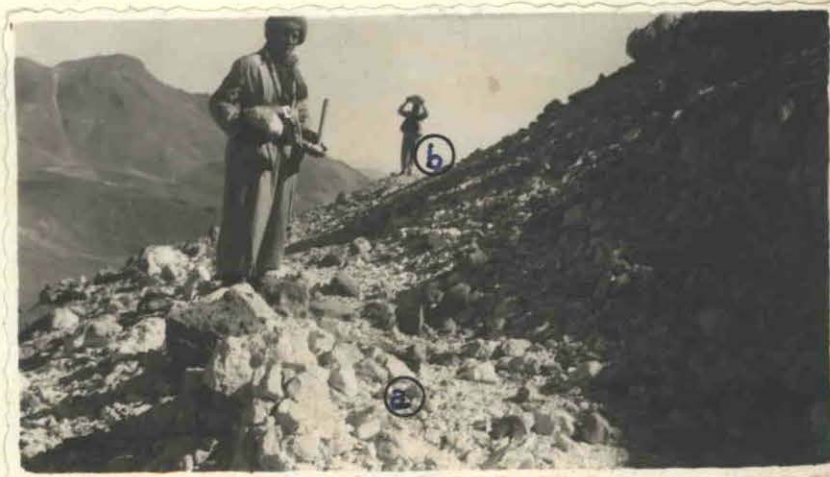
FOTO Nº 2 - Principales afloramientos de azufre en el Cº Niño - Mina "Iramain".-