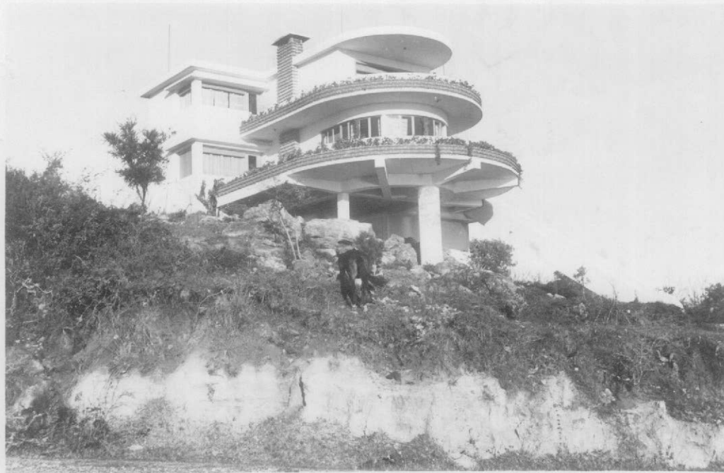
Fot.8- Ciudad de Salto. Casa sobre el camino de la cestería del río Uruguay construida sobre las areniscas cuarcíticas conglomerádicas y finas, abajo areniscas arcillosas claras, con manchas pardas amarillentas arcillosas.