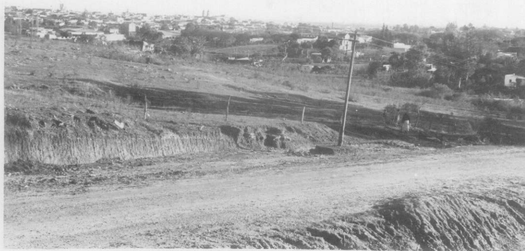
Fot.7- Ciudad de Salto. Corte del camino que baja hacia el puerto al oeste. Pequeño afluente norte del A o Sauzal. En la ladera afloran areniscas cuarcíticas y encima arenas rojizas limoníticas y rodados, con una intercalación de arenisca cuarcítica conglomerádica en su parte superior.