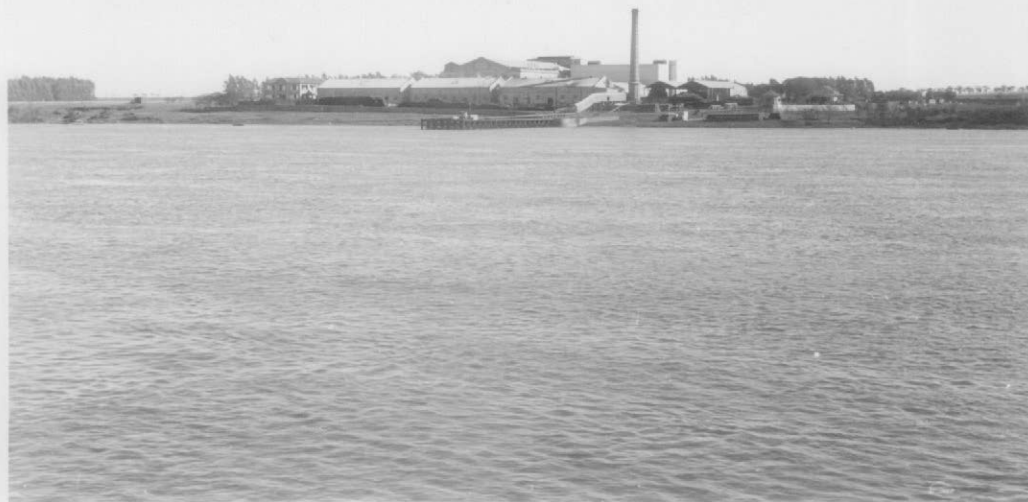
Fot.1- El Frigorífico Yuquerí construido en la cota de 20 m sobre la margen derecha del río Uruguay, visto desde el vapor; con su muelle de embarque. A la izquierda la casa de la Administración.