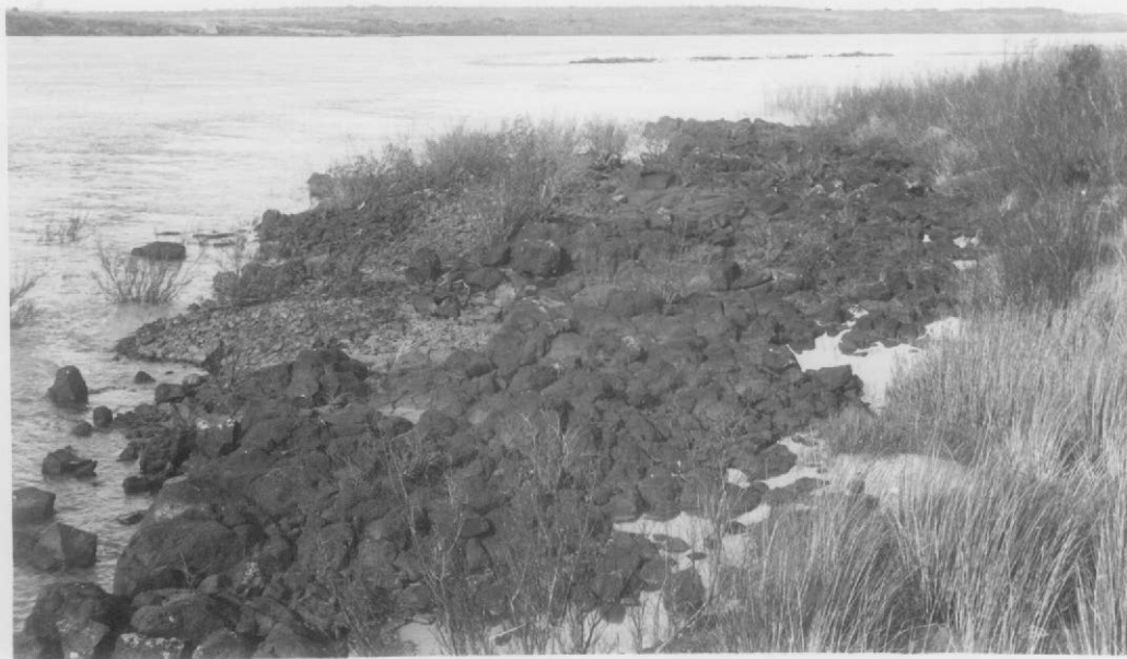
Fot.3- Afloramiento de meláfiro, en la costa del río Uruguay entre Puerto Yerúa y el Arroyo Hervidero, levemente inclinado al SSO. En el río, islote del mismo material que también aflora al pie de la barranca de la costa uruguaya, opuesta.