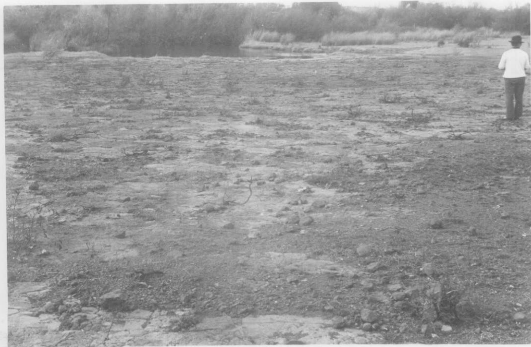
Fot.4- Plataforma de meláfiro suavemente abovedada a 300 m al SSO de la anterior, en la porción baja de la costa del río Uruguay, margen derecha. Nótese las numerosas fisuras cerradas con agua detenida en su superficie, en su borde oriental.