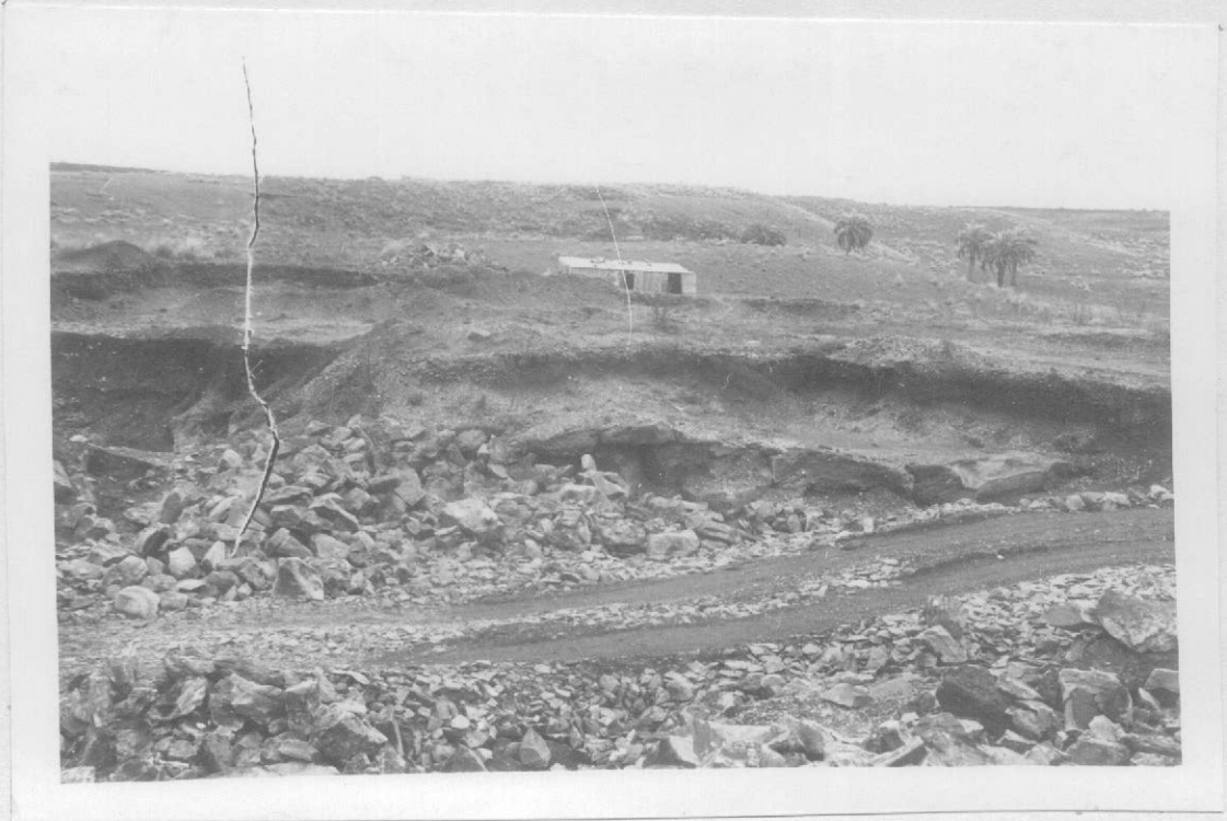
Fot.5- Canterita al O del Frigorífico Yuquerí y cerca del almacén de La Estrella. Encima rodados y arenas rojizas, debajo banco de arenisca cuarcítica conglomerádica, siguiendo arenisca cuarcítica fina, que se explota.