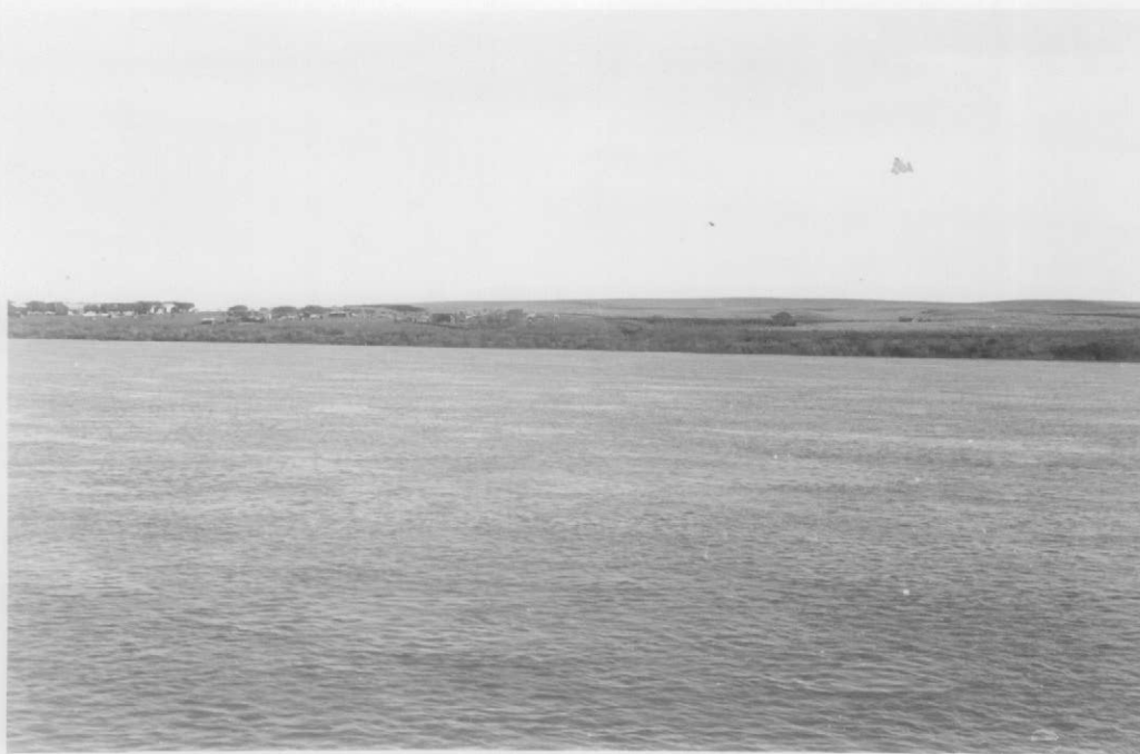
Fot.2- Las cuchillas de la margen derecha del río Uruguay inmediatamente al norte del Frigorífico Yuquerí, recortadas por numerosas cañadas que tienen agua. A la izquierda, población obrera del Frigorífico