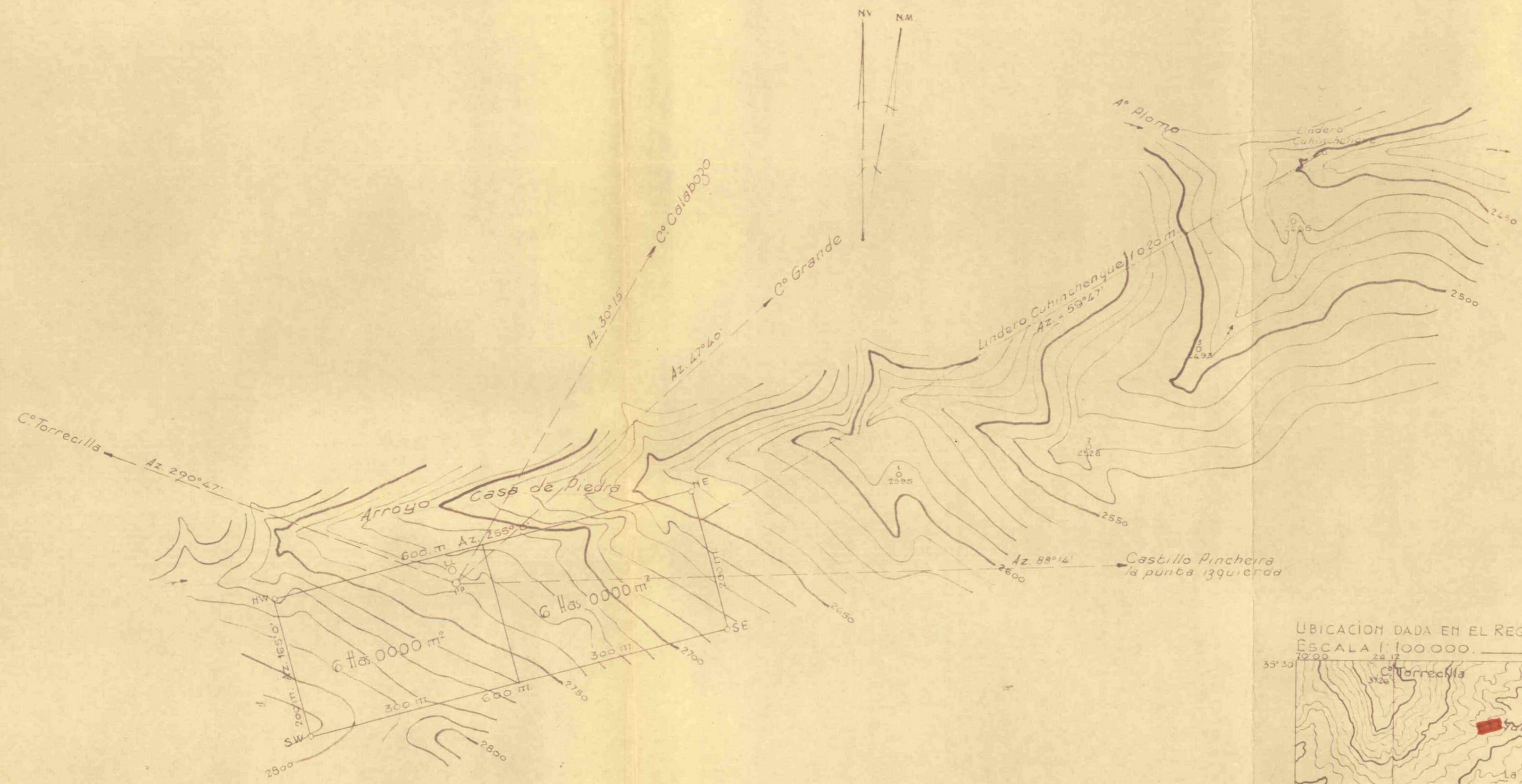
UBICACION DADA EN EL REGISTRO GRAFICO - PLANCHETA N° 53 ESCALA 1:100 000.