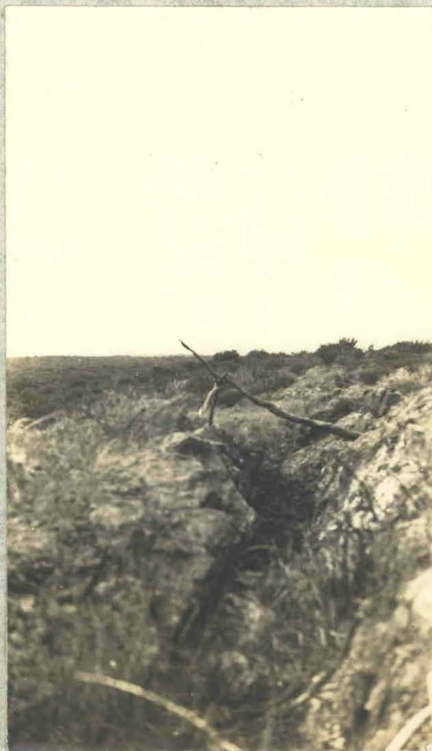
Fot.8.-Aguada del Monte-Una labor en mineral de hierro-Mina "9 de Julio".-