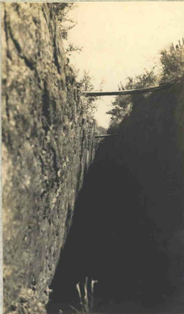
Fot.7.-Aguada del Monte-Labor principal de la mina de manganeso "25 de Mayo".-