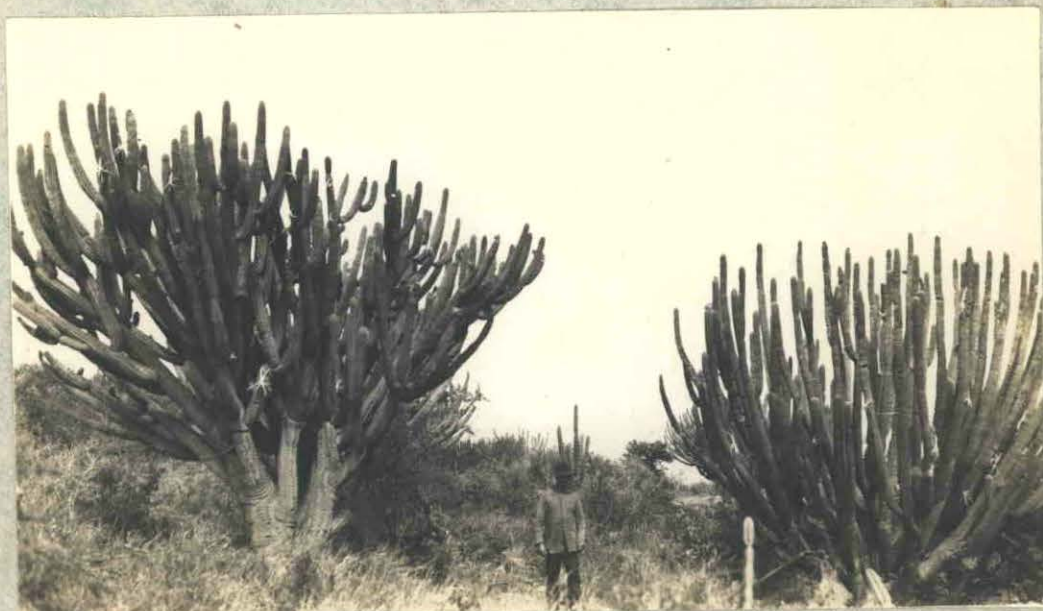
Fot.5.- Aguada del Monte - Cárcones (altura 4,00 m) muy difundidos en la región.-