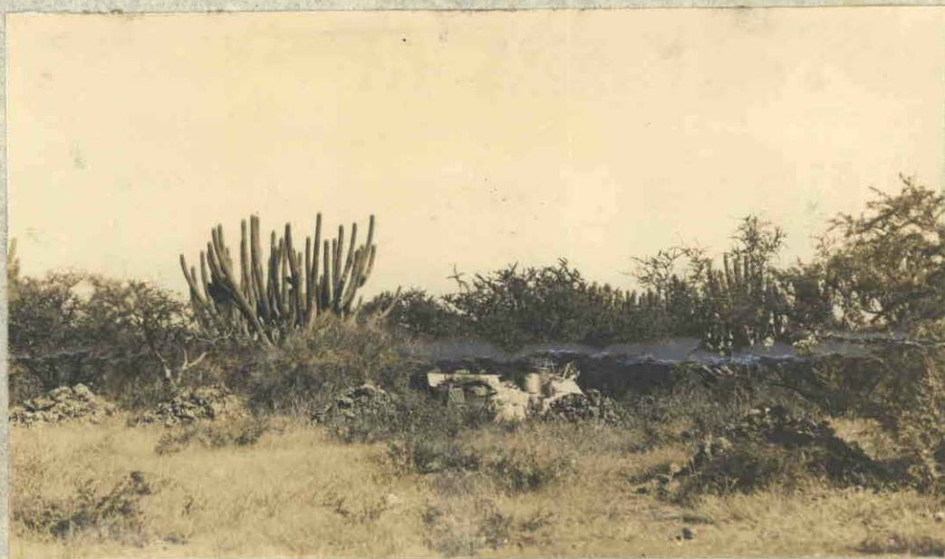
Fot.9.- Aguada del Monte - Cancha de minerales de manganeso. Mina "25 de Mayo".-