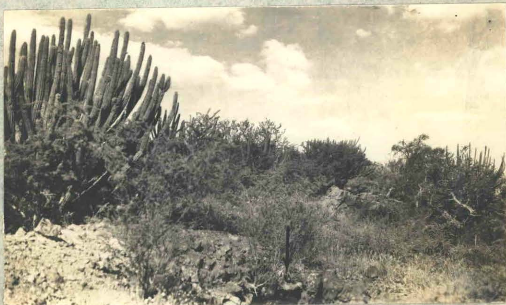
Fot.6.- Aguada del Monte - Afloramiento mina "12 de Octubre".-