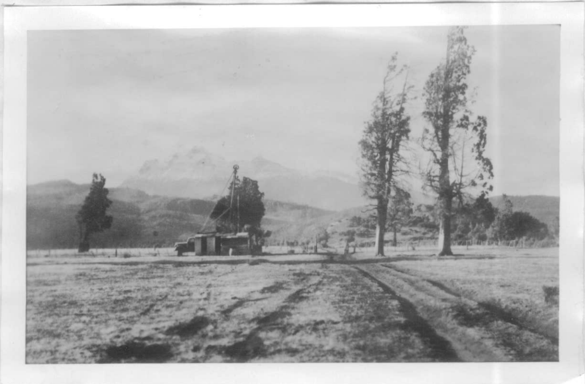
Perforación Río Grande Nº 2. Al fondo el Cerro Situación.