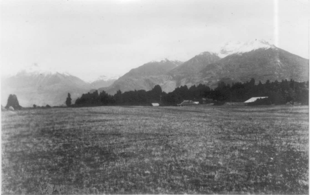
Parte ONO del valle. En primer plano, campo ocupado por el Señor Caveri.