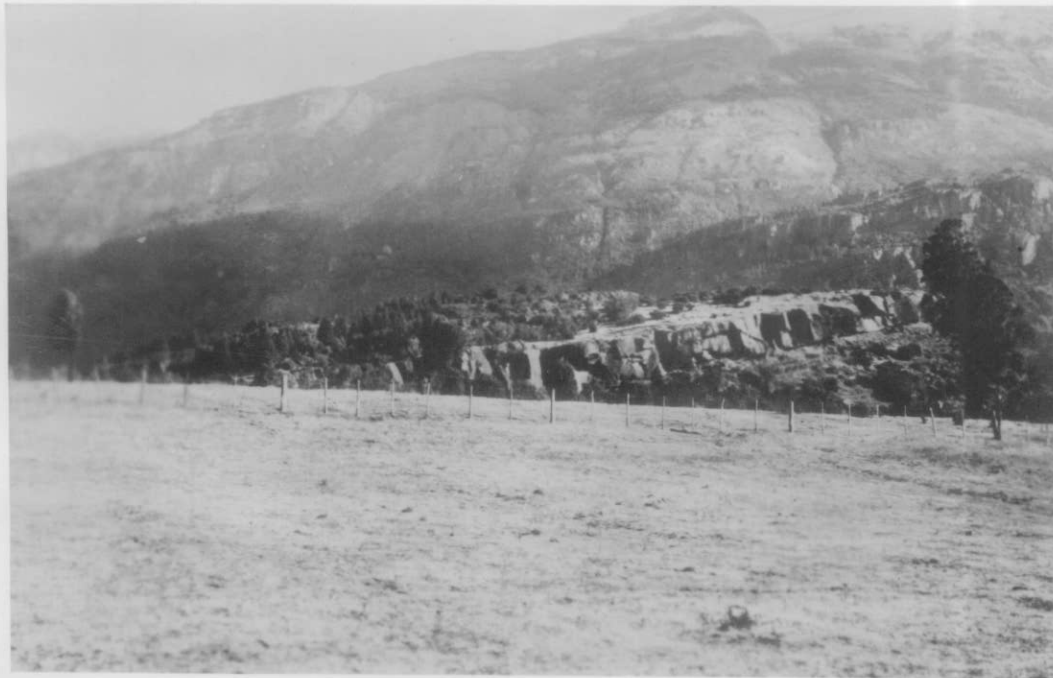
Afloramiento de pórfido cuarcífero.