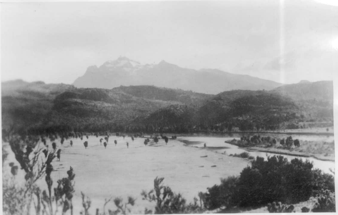
Hacia el O. del valle, al fondo el Cerro Situación.