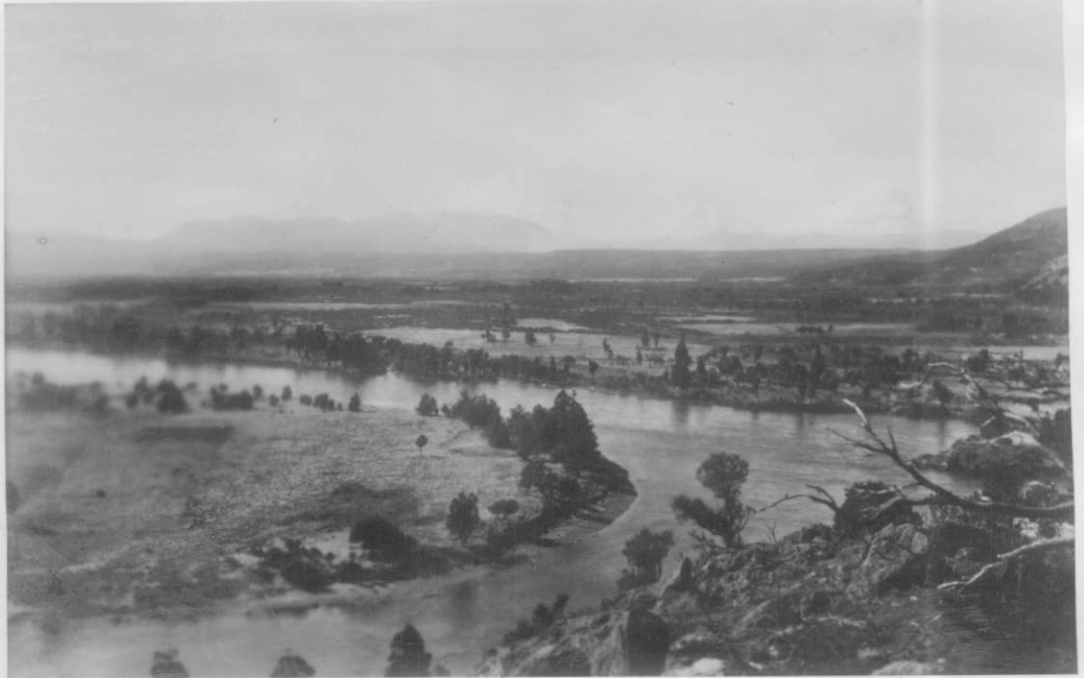
El Río Grande hacia el E., visto desde el morro frente a la casa Caveri.