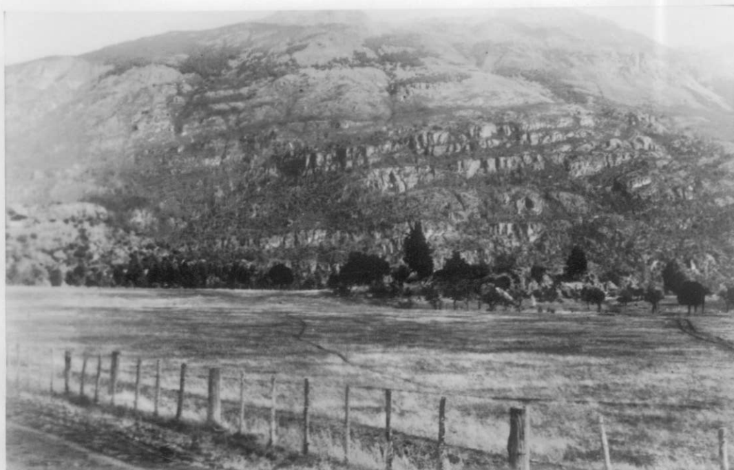
Ladera S. del valle. Bancos de pórfido cuarcífero.