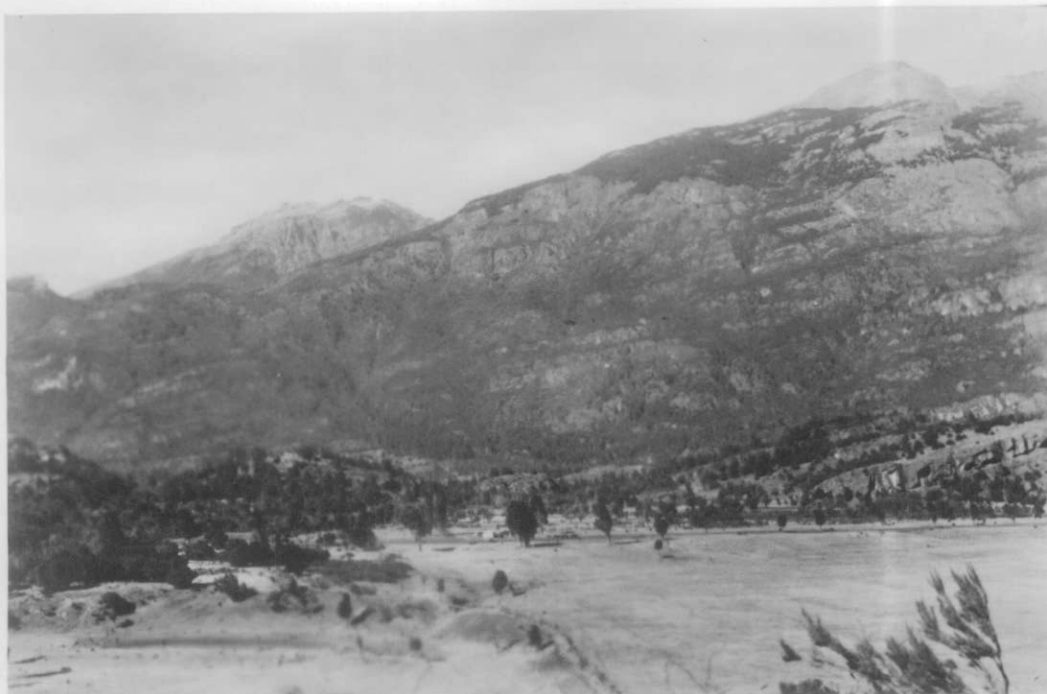
Ladera izquierda del valle; al fondo el campamento de la perforación Río Grande N° 2.