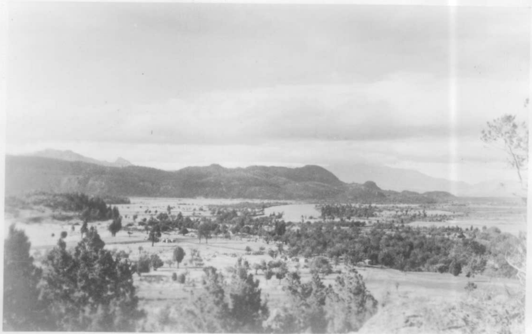
Idem, tomada hacia el NE.