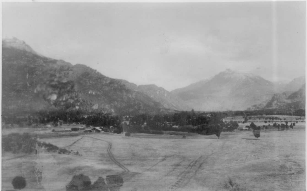
Vista hacia el ONO del valle. En primer término, campo ocupado por el Señor Caveri; al fondo el Cerro Ascención.