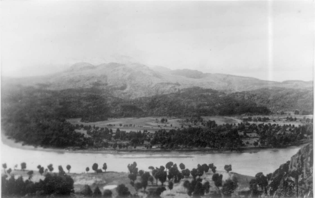
Otro aspecto del Río Grande.