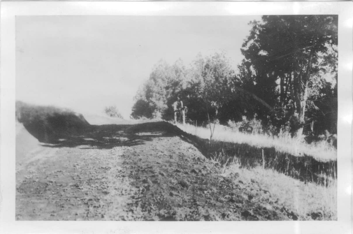
Ubicación de la perforación Río Grande Nº 3. El camino fué realizado para transportar la máquina.